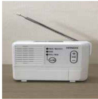
(町が貸し出しを行う戸別受信機) ※防災情報を受信できます。