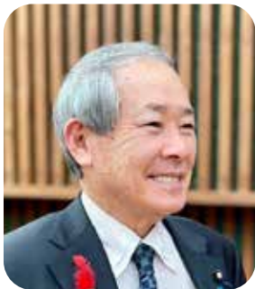
まさき ひでお 正木 秀男 議員

答 国や県の感染症対策マニュアル等に基づき、医療等様々なサービス提供体制を確保するため、専門職等人員の確保を図っている。