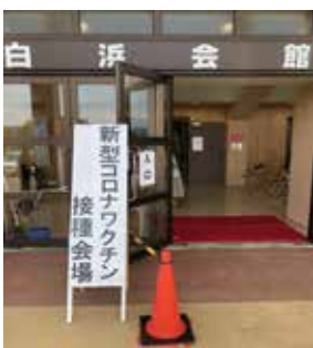
(ワクチン接種会場)

問 障害者及び幼児等の感染症対策はできているか。また、濃厚接触者への町独自の休業支援は。 答 オミクロン株の急激な感染拡大により更に注意し、感染防止対策を徹底している。また、町独自の休業支援策はないが、国の助成金制度の活用に向け、事業主の方へのご協力をお願いしている。