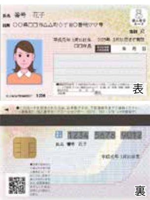
※マイナンバーカード イメージ