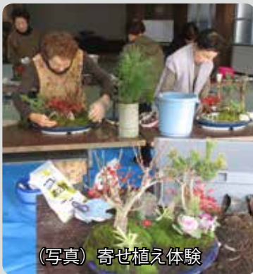
(写真) 寄せ植え体験