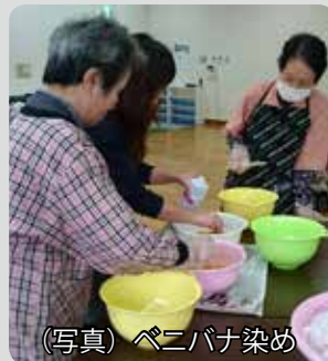
(写真) ペニバナ染め