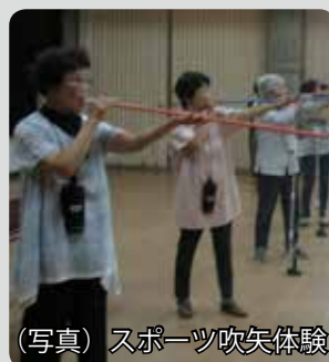
(写真) スポーツ吹矢体験