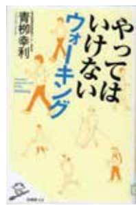
『やっぺはいけないうォーキング』/青柳幸利(作)

ウォーキングはただ歩けば健康のためになると思っていませんか。この本では、歩き方や時間帯、その人に合った距離が問題だと説明されています。「大股で歩くと自然に姿勢がよくなる」等、ウォーキングの仕方がシンプルに書かれていて、わかりやすい一冊です。