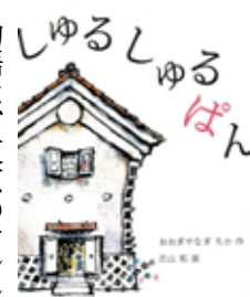
『しゆるしゆるばん』 / おおぎやなぎちか(作)

物語は、東京のマンションで家族3人で暮らしていた男の子が、小学校6年生になるタイミングで、お父さんの故郷、岩手県に引っ越すことから物語が始まります。今までと違い、木造二階建てのお家、両親と祖母、方言で「おひこさん」と呼ぶ、曾祖母の5人暮らしの生活です。新しい生活はおかしなことが続きます。それは「しゆるしゆるばん」のせいだと男の子の