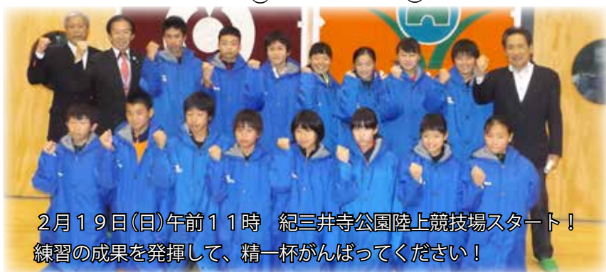
2月19日(日)午前11時 紀三井寺公園陸上競技場スタート！ 練習の成果を発揮して、精一杯がんばってください！