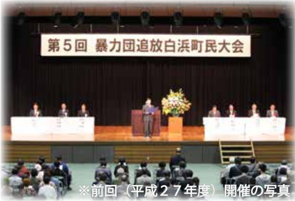
※前回（平成27年度）開催の写真

暴力団追放のためには町民が一致団結して活動を行っていくことが必要であり、本大会を契機として「暴力団追放」気運を町全体により一層浸透させるために開催します。