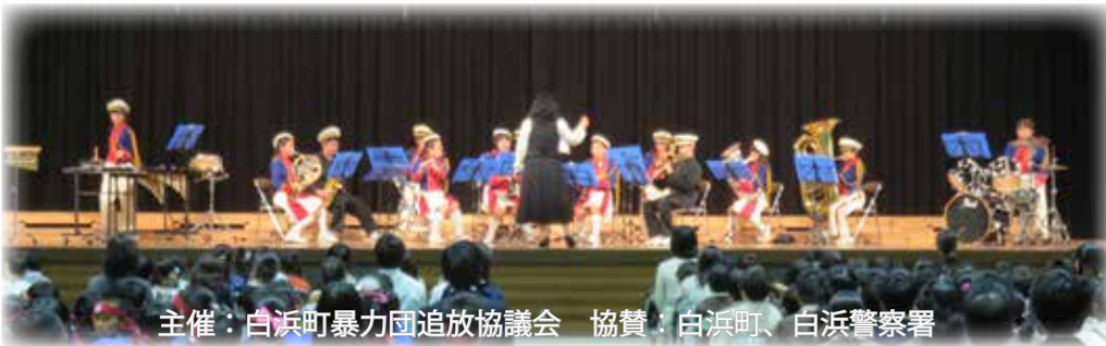
主催：白浜町暴力団追放協議会 協賛：白浜町、白浜警察署