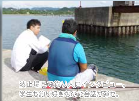
波止場にて釣り人にインタビュー。学生も釣り好きなので会話が弾む。