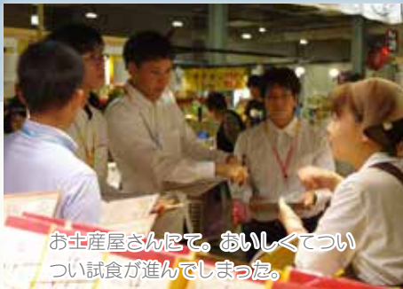
お土産屋さんにて、おいしくておいしい試食が進んでしまった。