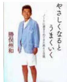
『やさしくなるとうまいく ノートに書きとめてきた教えと言葉』勝俣州和 (著)

著者が、数十年も前から「い話」「心に残った逸話」「参考になった教え」などを書きとめてきた何冊にもなるノートの中から、選ばれた37の話が書かれています。タイトルの「やさしくなるとうまいく」は師匠の萩本欽一さんから教えられた言葉です。