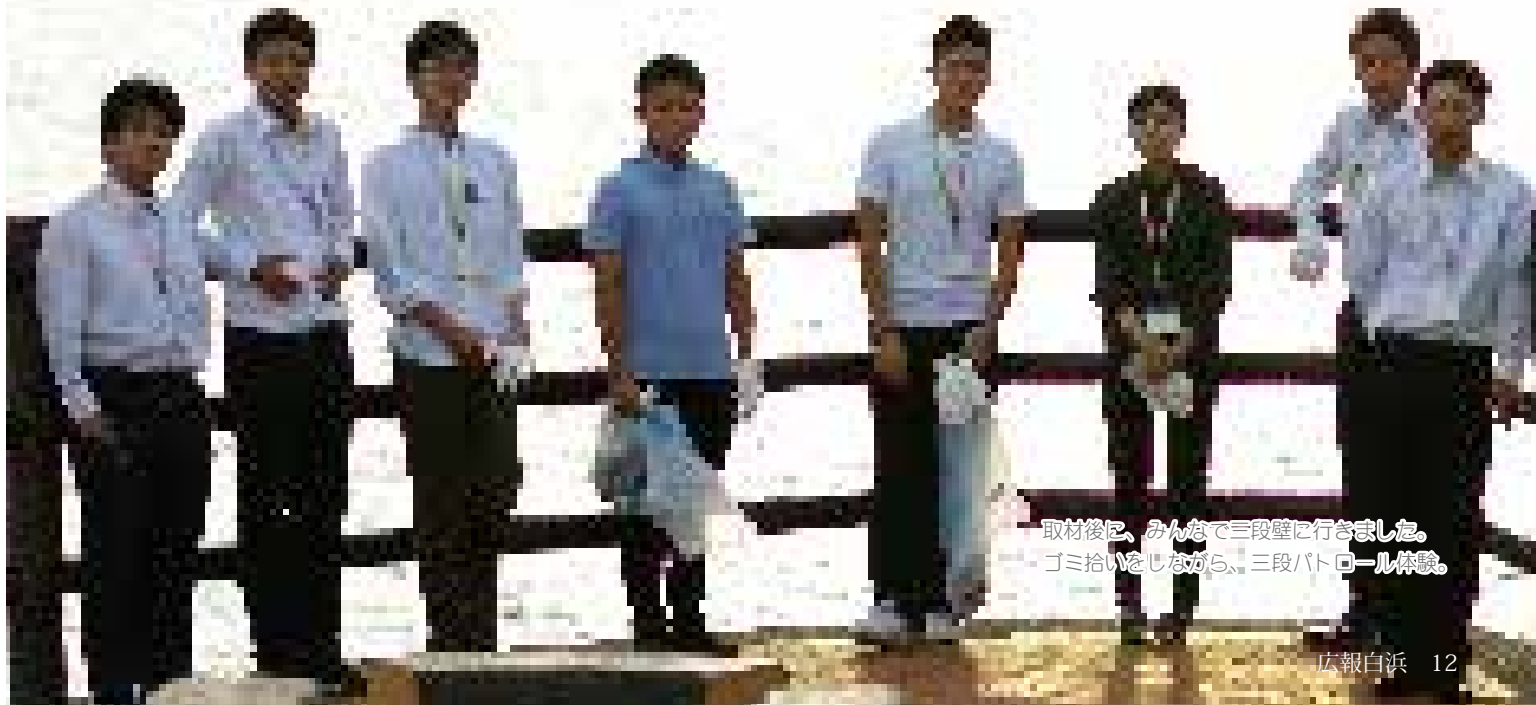
取材後に、みんなで三段壁に行きました。ゴミ拾いをしながら、三段パトロール体験。