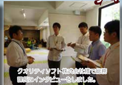
クオリティソフト株式会社様で総務課長にインタビューをしました。