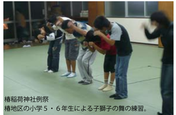
椿稲荷神社例祭 椿地区の小学5・6年生による子獅子の舞の練習。