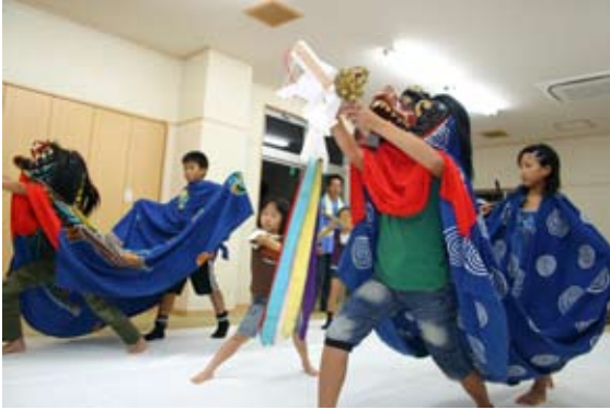
熊野三所神社例祭 御舟地区の子ども獅子舞の練習風景。 「頭は重たいけど、楽しいよ」と子どもたち。