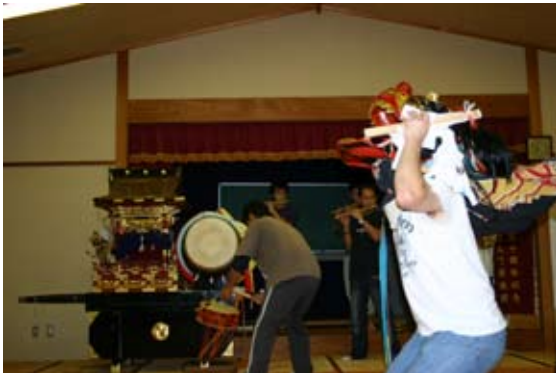
御書祭（山神社） 伝統にのっとりて連日、獅子舞の練習が行われています。