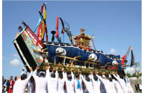
日の出神社例祭 氏子たちの手で高々と天に持ち上げられた、海水に浸かっ てずっしりと重い、舟の御輿「御舟」。