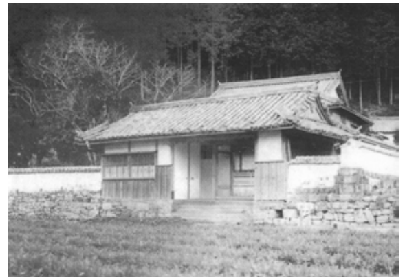
白浜町久木にあった小山肆成生家(写真は大正時代)