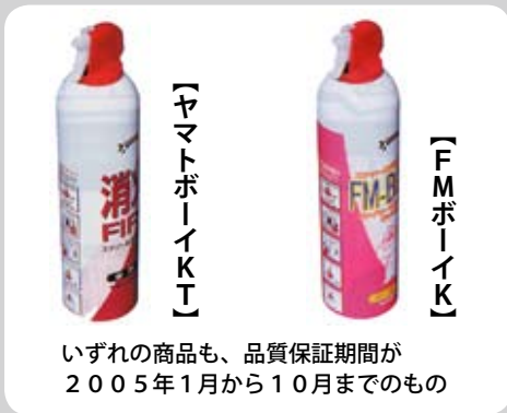
いずれの商品も、品質保証期間が2005年1月から10月までのもの

※品質保証期間が2005年11月以降の商品は、製造方法を改善し、品質管理も徹底しています。