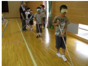
【福祉体験（アイマスク）】