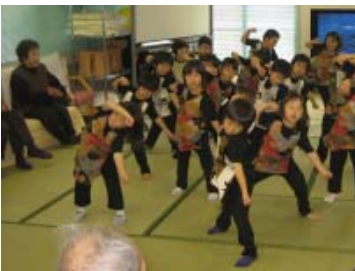
【高齢者施設への訪問】