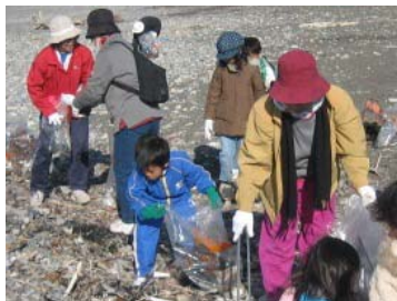
【清掃ボランティア活動】