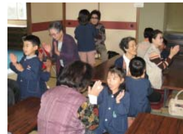
【いきいきサロンとの交流】