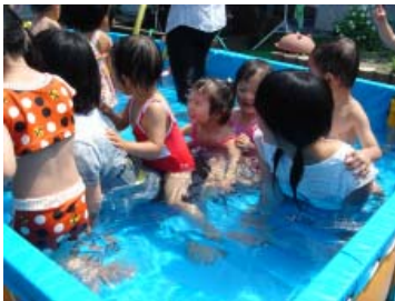
【サマーボランティアスクール】