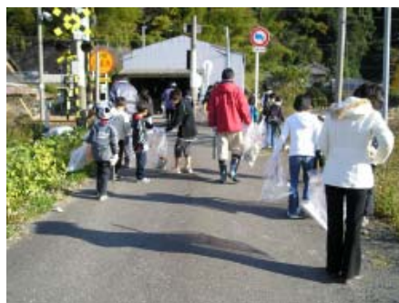
【大人も子どもも協力して(安宅地区)】