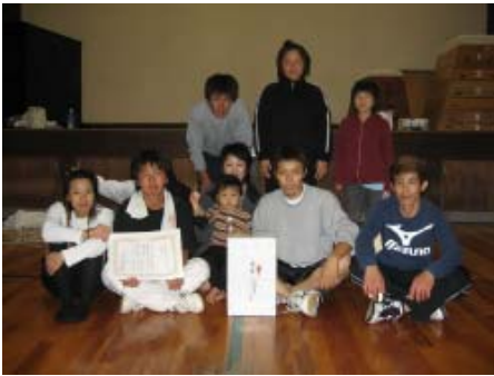
【優勝チーム ガッツだぜ!!】