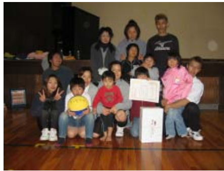
【優勝チーム ワンダフル1】