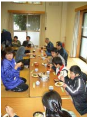
【おいしくいただきました】