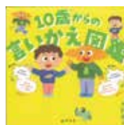
「10歳からの言いかえ図鑑」 大野萌子／著 幻冬舎