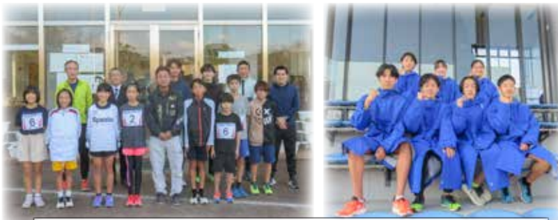
2月11日（日）午前11時 紀三井寺公園陸上競技場スタート！