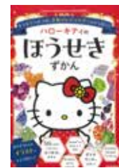
「ハローキティのほうせきずかん」 日本宝石協会／監修 河出書房新社