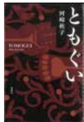
「ともぐい」 河崎秋子／著 新潮社