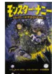
「モンスター・ナニー 3きょうだいとお世話係のモンスター」 トウテツキ・トロンノ／作 バン・ピトカネン／絵 古市真由美／訳 世界文化社