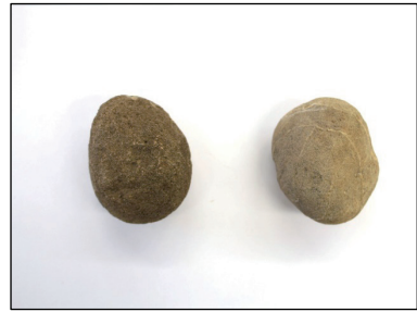
出土遺物 (河原石・投弾用か)