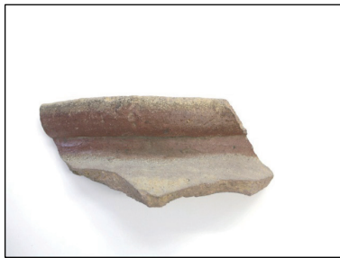
出土遺物 (備前焼甕)