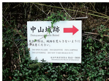
誘導板 (史跡地外に設置)