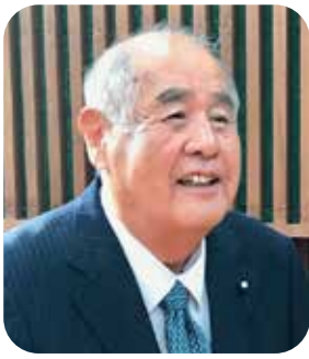
みなみ かつや 南 勝弥 議員