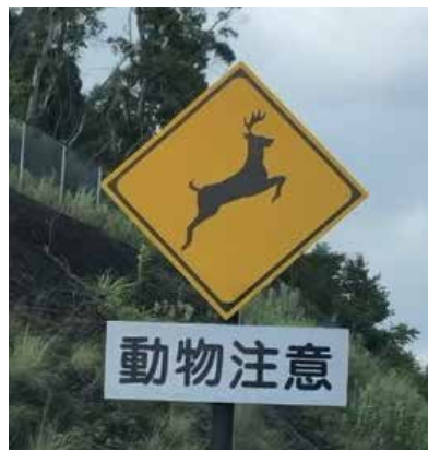
(動物等の飛び出し注意看板)

答 道路管理者である紀南河川国道事務所や県と連携し、ドライバーへの注意喚起も含めた有効な対策を検討していく。