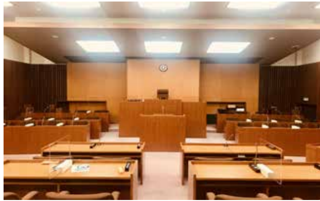
(白浜町議会 議場の風景)

に従った議会の統一した意思として、議決はある意味で議員を拘束する部分もあるという認識をお願いしたいものである。