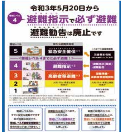
(避難情報の発令基準)

答 防災まちづくり係では、大規模災害に備えた各種計画の策定や備蓄物資等の管理などソフト面の業務を主に行っている。地域防災推進係では、津波避難タワーや防災行政無線等の施設整備や各自主防災組織との連携、防犯、交通安全施策などの業務を行っている。