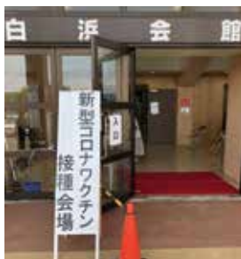
(ワクチン接種会場)

問 2回目の受付を開始しているが、これにより65歳以上の未接種者はどの程度解消されるか。また、接種に対する副反応について伺う。