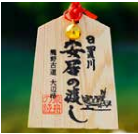
(安居の渡し通行手形)