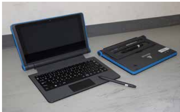
(児童・生徒が一人一台利用するノートパソコン)

答 国の指針やガイドブック等を参考に、ブルーライトや電磁波が子どもの健康を害することがないよう、ICT機器を安全かつ適切に利用していく。また、生活習慣に関する調査を実施することで、生徒自身が生活を振り返る機会を設け、不規則な生活に対しては計画的に生活指導を行うなど、児童の心身の育成に取り組んでいる。