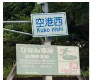
(道路標識と劣化した避難看板)