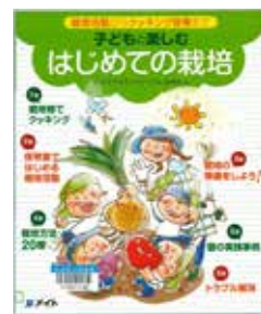
『子どもと楽しむはじめての栽培』/メイト (出版社)

日置分室所蔵のこの本は、育てた野菜を使ったクッキングレシピや、幼稚園や保育所で実際に栽培に取り組んでいる活動の紹介、鳥や虫の害など栽培活動で困ったときに役立つ情報などが掲載されています。