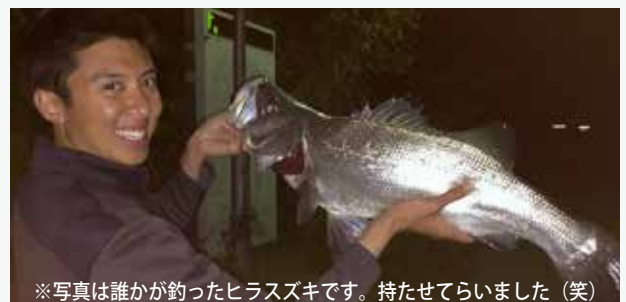
※写真は誰かが釣ったヒラスズキです。持たせてもらいました（笑）

これから夏が近づくと新しい釣りができると思い、もうすでにワクワクしています。アジやキスなどの魚も楽しみですがハマチやシイラといった大型の魚も釣りたいですね。ハワイではシイラのことを「マヒマヒ」と言い、レストランでも一番人気があります。和歌山では磯からシイラが釣れるって聞いたから本当に楽しみです。