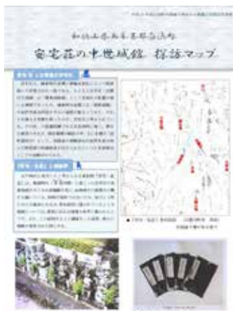
安宅荘の中世城跡探訪マップ