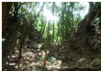
八幡山城跡 大堀切

また、城館群の整備事業の一環として、中山城跡と高瀬要害山城跡の登り口に、詳細な説明看板を設置していますので、探訪マップと合わせて、利用ください。