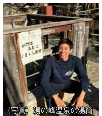
(写真) 湯の峰温泉の湯筒