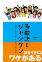
『多数決とジャンケン』 かとうけいへい(著) 加藤良平(著)

本館蔵書のこの本は、物事の「決まり方」をテーマに、多くの人が納得できる物の決め方として、正しいと考える人の多い主張を認めること(多数決など)と、強い弱いにほとんど関係なく、偶然の結果に頼って決めること(ジャンケンなど)について