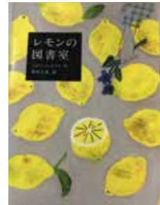
『レモンの図書室』 ジョー・コットリル(著)

主人公はカリプソという、本が大好きな10歳の女の子。お母さんを亡くして作家のお父さんと二人暮らしですが、お父さんはまだお母さんがいない悲しみから抜け出せずにいるため、カリプソは孤独で、本がたった一つのより所でした。そんなときに、メイとい