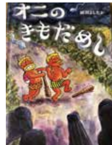
『オニのきもだめし』岡田よしたか(著)

ある晩、こわがりなオニふたりが夜道を歩いておりました。そこにひとだまやゆうれいがあらわれて、オニたちをこわがらせます。