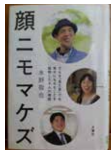
『顔ニモマケズ』水野敬也 (作) / 文響社

著者は、思春期のころ、醜形恐怖という自分の外見への執着に悩み、以来外見へのこだわりや劣等感は幸福を大きく左右する問題だと感じ、「見た目問題」に興味を持つようになりました。NPO法人マ