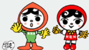
人KENまもる君 人KENあゆみちゃん (人権イメージキャラクター)

毎週月～金曜日(※) 午前8時30分～午後5時15分 ※12/29～1/3、休日を除く