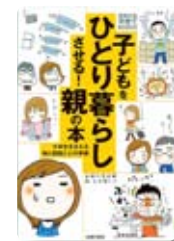
『子どもをひとり暮らしさせる！親の本』 ／主婦の友社（編）