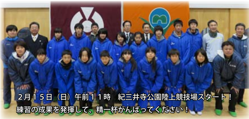
2月15日（日）午前11時 紀三井寺公園陸上競技場スタート！ 練習の成果を発揮して、精一杯がんばってください！