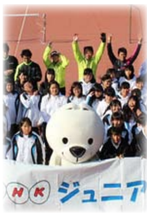
● 紀の国わかやま国体

終了後は全員が「楽しかった」と口をそろえるなど、参加した生徒にとっては技術の向上はもとより、大変良い思い出となる素晴らしい機会となりました。