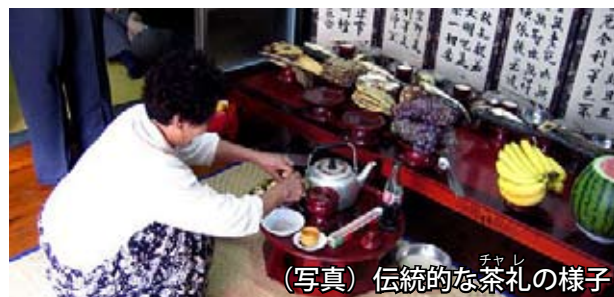
（写真）伝統的な茶礼の様子