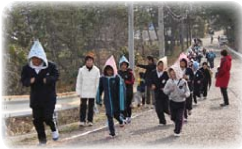
【高台に避難する児童と住民】