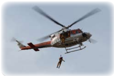
【防災ヘリコプターによる救助訓練】

その後、中地区の会場では、陸上自衛隊による炊き出し訓練や水陸両用車での上陸訓練、県防災航空隊による救助訓練などが行われました。