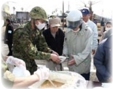
【陸上自衛隊による炊き出し訓練】