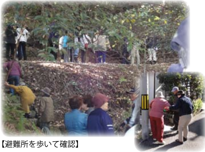
【避難所を歩いて確認】