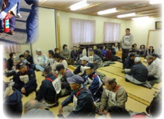
【避難者として集まった住民の皆さん】