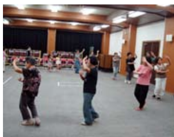
【日置川音頭練習風景】

旧日置川町から親しまれ続けている盆踊りを後世へ継承するため、日置家庭学級でも毎年講座に取り入れていきます。