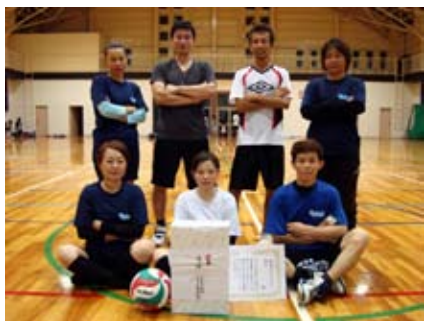
【バレーボール大会 優勝チーム】