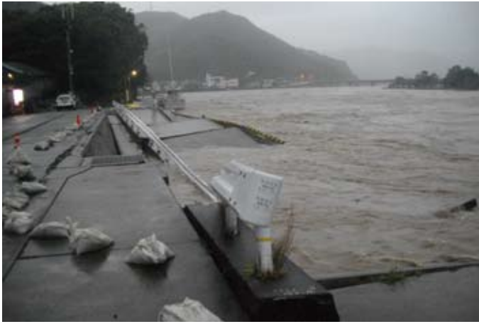
▲崩落した日置港湾施設の物揚場（日置地区）