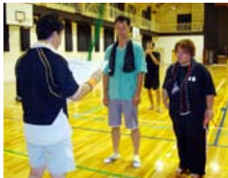
【バドミントン大会 優勝チーム】