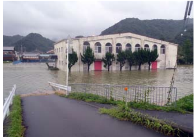
▲冠水した北富田小学校（内ノ川地区）