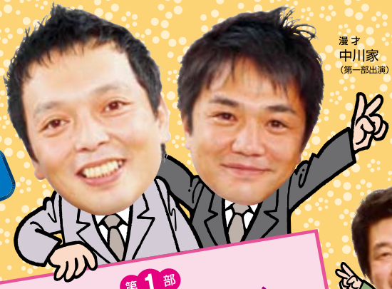
漫才 中川家 (第一部出演)

第1部 お笑いオンステージ 博多華丸・大吉 中川家 パンクブーブー 笑ハンティング