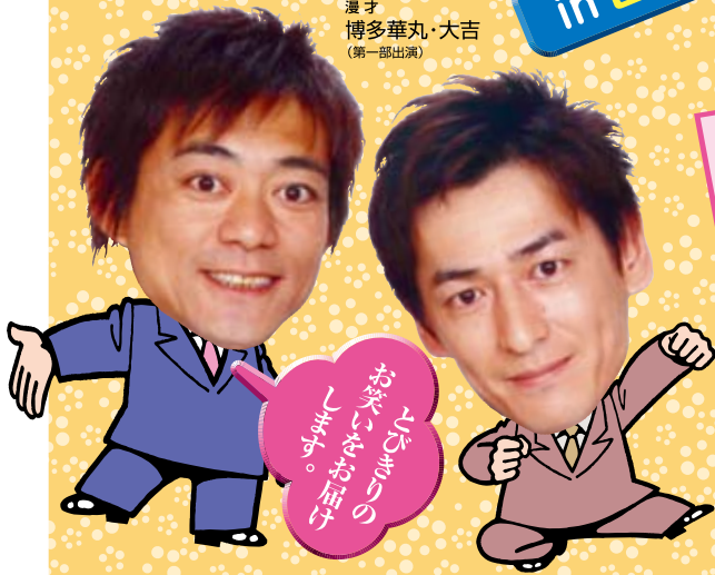
漫才 博多華丸・大吉 (第一部出演)