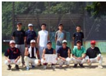
【野球大会 優勝チーム】