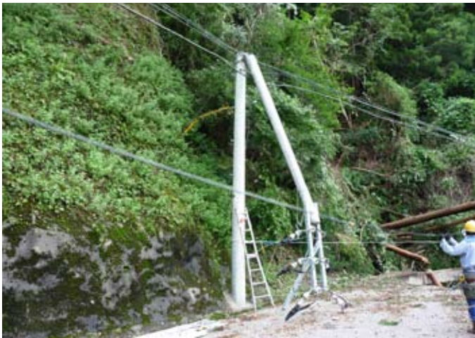
▲電柱の倒壊（宇津木地区）