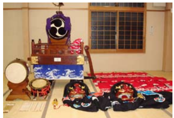
【宝くじ助成金で整備した祭用具】

この事業は、宝くじ受託事業収入を財源とし、コミュニティの健全な発展を図るとともに宝くじの普及広報事業を行うために、必要な施設または設備の修繕整備に助成しているものです。