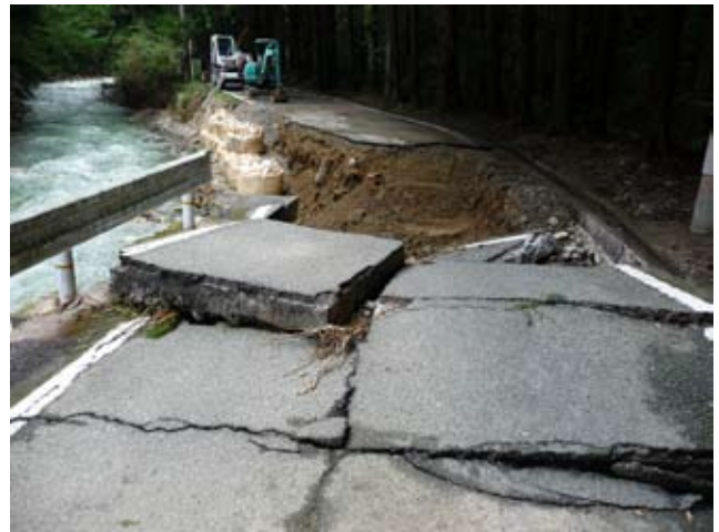
▲県道大塔日置川線（玉伝地区）