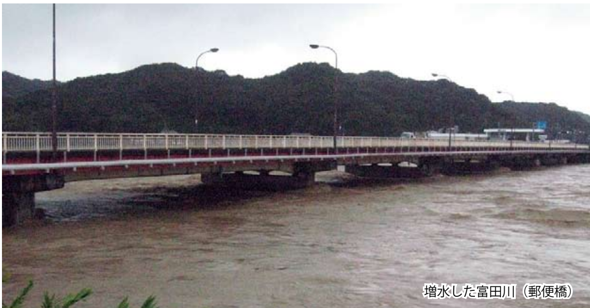
増水した富田川（郵便橋）

8月25日にマリアナ諸島近海で発生した台風12号は、ゆっくり北上し強い勢力を保ったまま9月3日午前10時前に高知県東部に上陸し、岡山県南部に再上陸、その後、日本海に抜けました。和歌山地方気象台の白浜町の状況は、南紀白浜空港で最大瞬間風速35mを観測、日置川の安居の観測点で8月30日から9月4日までの雨量が840mmに達しました。