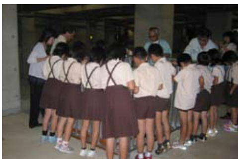
【施設を見学する小学生】