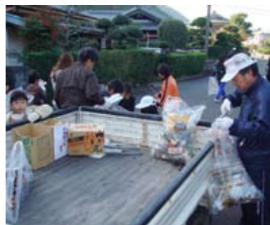
【クリーングリーン】

12月12日に日置小学校、日置中学校、安宅小学校の子どもたちを中心に、クリーング