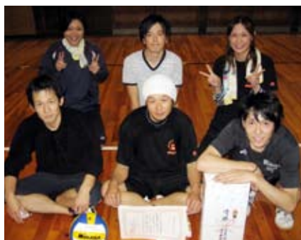
▲勤労者バレーボール大会 優勝チーム

◆勤労者バレーボール大会 11月13日、7チーム参加 優勝 ししまい改 準優勝 フレンズ 第3位 レーベンハート 第3位 愛祐丸