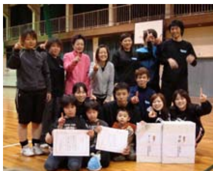
▲ソフトバレーボール大会 優勝チーム

◆ソフトバレーボール大会 11月27日、18チーム参加 優勝 Team天B 準優勝 ディアブロ 第3位 Team天C 第3位 愛祐丸A 皆さんお疲れさまでした。