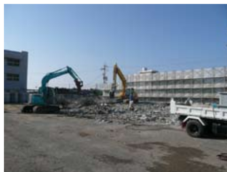
【日置小学校体育館建設予定地】

また、体育館建て替えに伴い、体育館と隣接して建設されていた日置中学校技術科室も同じく建て替えることとなり、こちらはすでに解体工事が完了し、建築工事中です。