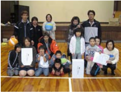
▲ソフトバレーボール大会 優勝チーム