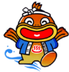
【クエキャラクター最優秀賞作品】