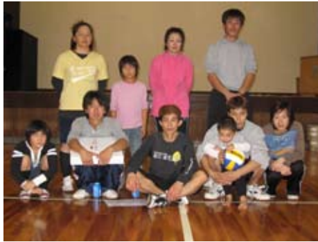
▲勤労者バレーボール大会 優勝チーム