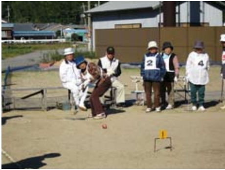
▲ゲートボール大会の様子

日置川地域体育振興協議会主催で、11月13日にゲートボール大会、14日に勤労者バレーボール大会、28日にソフトバレーボール大会を開催しました。結果は次のとおりです。