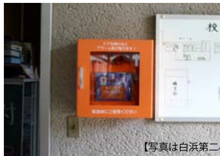
【写真は白浜第二小学校】

児童・生徒の生命を守るという観点から学校施設へのAED（自動体外式除細動器）の設置を平成18年度から行ってきましたが、このたびすべての小中学校への設置が完了しました。