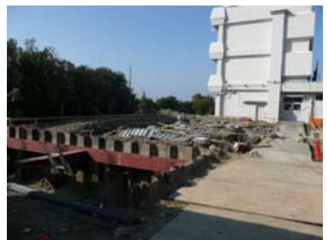
【日置中学校技術科室建設予定地】