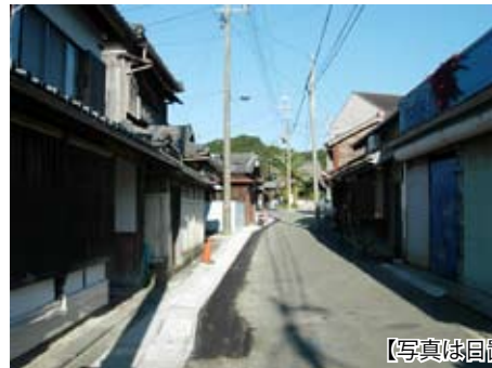
【写真は日置地区浜町】

日置地区の老朽化した側溝を昨年度より整備しています。少しずつではありますが、今後も取り組みを進めていきます。