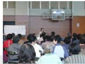
音楽を通して楽しむ、笑う!

午後からは、合併後広い範囲の活動となったボランティア同志の交流として、玉入れや白浜音頭・日置川小唄の盆踊りで賑やかに楽しい時間を過ごしました。