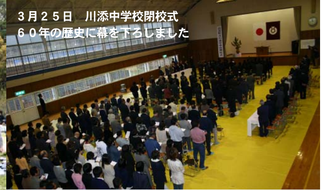
3月25日 川添中学校閉校式 60年の歴史に幕を下ろしました