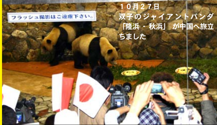
10月27日 双子のジャイアントパンダ 「隆浜・秋浜」が中国へ旅立ちました