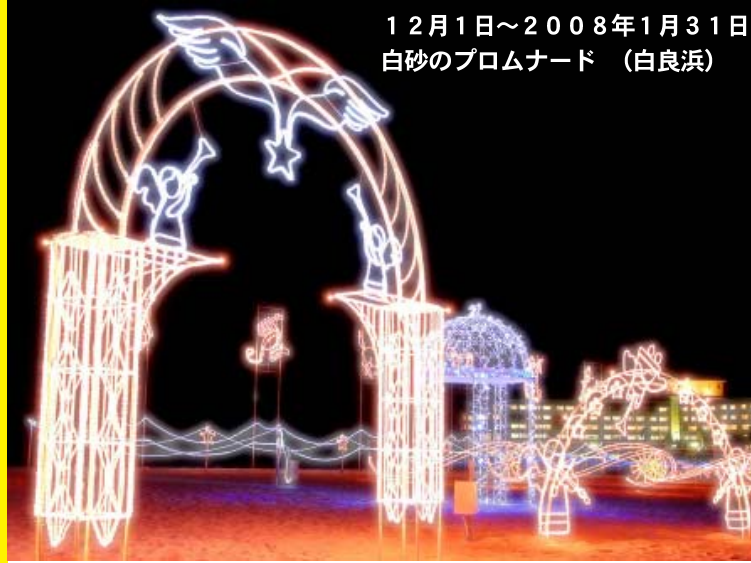
12月1日～2008年1月31日 白砂のプロムナード (白良浜)

早くも師走となりました。 この1年、振り返ってみると町にも様々なできごとがありました。 皆さんの1年はどうでしたか？