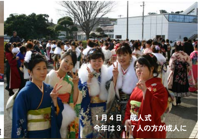
1月4日 成人式 今年は317人の方が成人に