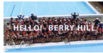
【ベリーヒル小学校へのビデオレター】

現段階で、返事（映像）を紹介できなくて残念ですが、このように外国の文化や歴史、生活の様子等を理解し、交流しあうことは、国際社会に生きる子どもたちにとってとても大事なことだと思っています。