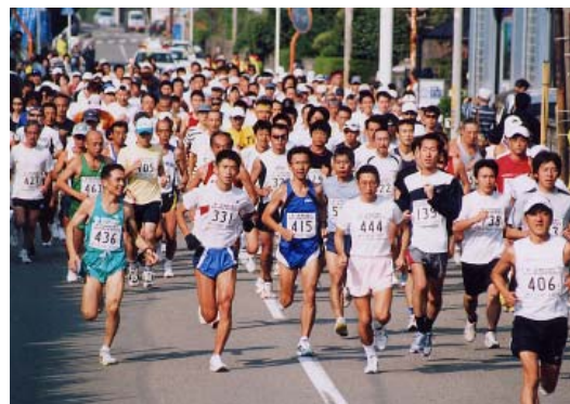
大会運営にご協力いただきました皆さま、暖かい声援を送ってくださいました皆さま、本当にありがとうございました。（事務局より）