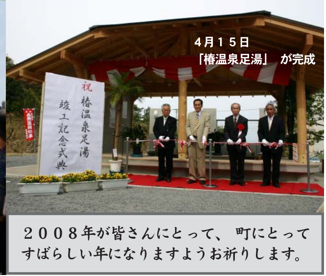
4月15日 「椿温泉足湯」が完成

2008年が皆さんにとって、町にとって 素晴らしい年になりますようお祈りします。