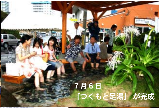
7月6日 「つくもと足湯」が完成