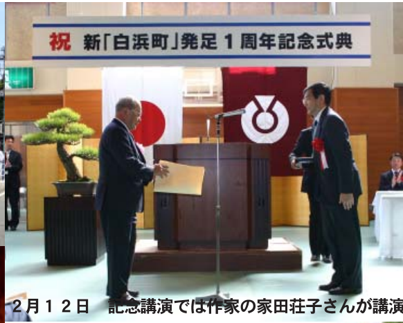
祝 新「白浜町」発足1周年記念式典