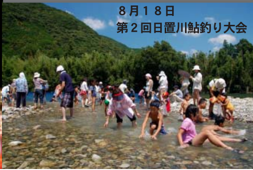
8月18日 第2回日置川鮎釣り大会

早くも師走となりました。 この1年、振り返ってみると町にも様々なできごとがありました。 皆さんの1年はどうでしたか？