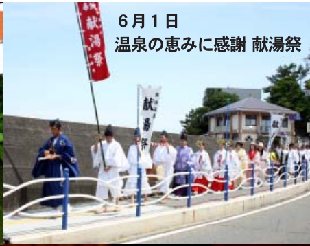
6月1日 温泉の恵みに感謝 献湯祭