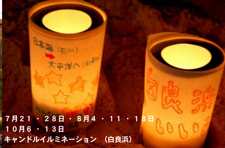
7月21・28日・8月4・11・18日 10月6・13日 キャンドルイルミネーション (白良浜)