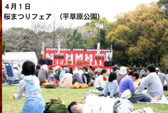
4月1日 桜まつりフェア (平草原公園)