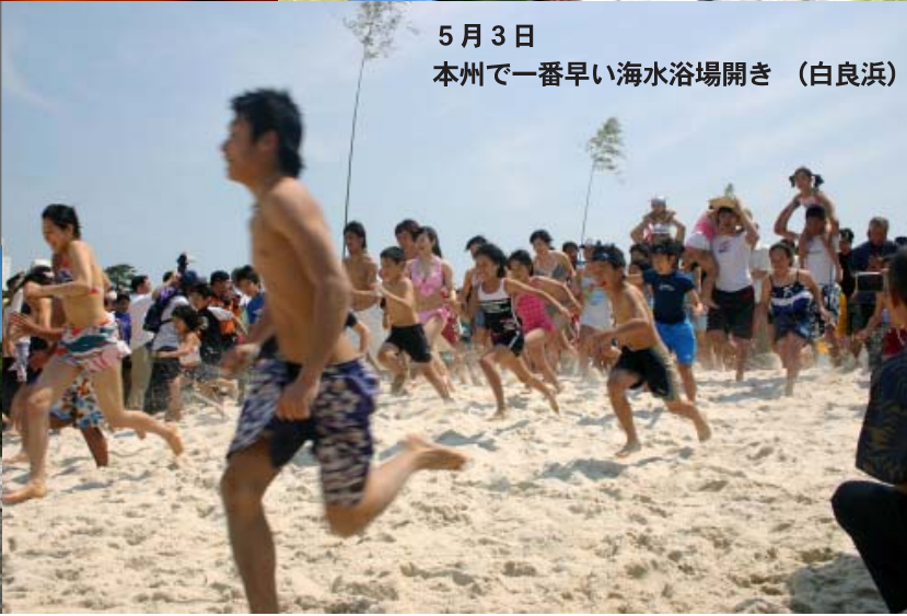
5月3日 本州で一番早い海水浴場開き (白良浜)