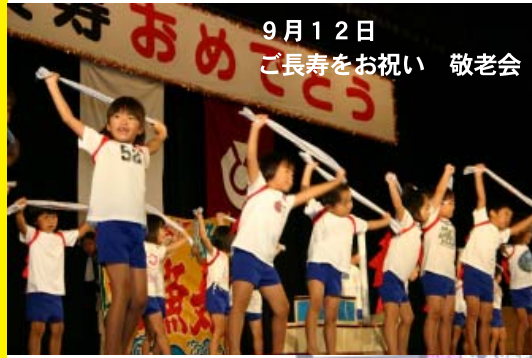
9月12日 ご長寿をお祝い 敬老会