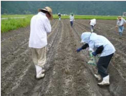
【9月10日の種まきの様子】

9月10日にそばの種まきを行ったところ、10月中旬には一面真っ白なそばの花が見られ（表紙写真）近くを通る方たちの目を楽しませてくれました。