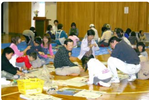
富田小学校「3世代いきいきフェスタ」(昨年)

学校の活動を地域に公開することで、保護者や地域の人々に学校への理解と関心を深めてもらい、地域ぐるみで子どもを育てる機運を高めてもらおうと、和歌山県では、11月を学校開放月間としています。