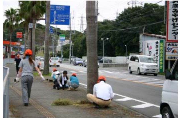
【手分けして効率よく作業をする白浜愛創会の皆さん】