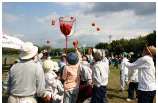
【勝負となれば、玉入れも真剣そのもの！】

秋とはいえ、日中はまだまだ暑い中でしたが、皆さん元気いっぱいにはスプーンリレーやアメつかみ競争、玉入れ競争などの競技を楽しんでいました。