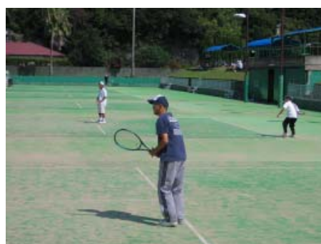
【町営日置川テニスコートで】

今年、参加競技種目にグラウンドゴルフが新たに加わり、全部で15種目の競技が町内各地の会場で行われました。