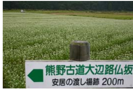
【仏坂の案内看板の下に広がるそば畑】

今年度は安居地区の熊野古道沿い（安居の渡し場跡付近）の約50アール（5,000㎡）の農地を活用し、地元の方々が中心となって栽培を行っています。