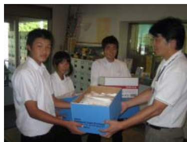
【日置中学校生徒会の皆さん】