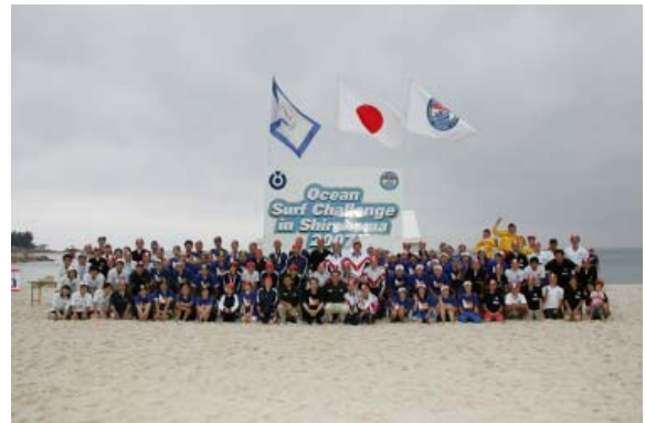
【海の安全を守るライフセーバーの皆さん】

また、大会には夏の期間、白良浜でライフセーバーとして、監視活動をおこなう大阪体育大学のメンバーも出場し、各種競技で優秀な成績をおさめました。