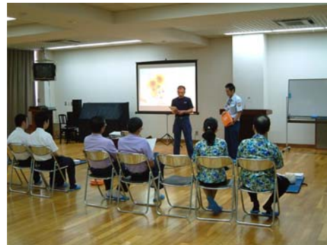
【説明を受ける受講者の皆さん】