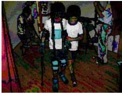
【田野井小学校 アイマスク体験】

今年、6月15日の日置中学校の総合学習の受け入れに始まり、田野井小学校、椿小学校の生徒の皆さんにさまざまな体験をしていただきました。日置中学校では、手話の講習を行ったり、ホームヘルパーと同行