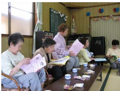
【寒さ浦地区 ふれあい・いきいきサロン】

皆さんも体験を通して感じてみませんか。関心のある方は、本会事務局までご連絡ください。皆さんのお問い合わせをお待ちしております。