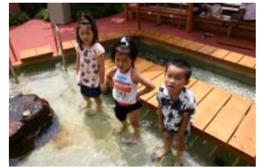
「うちのお風呂もこんなのがいいな。」(白浜エネルギーランド)