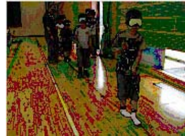
【椿小学校 高齢者疑似体験】

皆さんも体験を通して感じてみませんか。関心のある方は、本会事務局までご連絡ください。皆さんのお問い合わせをお待ちしております。