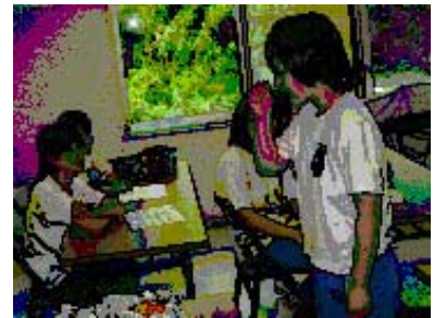
【日置中学校 手話体験】

「体の不自由な方はどれくらい大変なの?」、「高齢の方にどんな風に接したらいいの?」、そんな疑問に少しでも役立てていただくために、今年も学校の総合学習や福祉体験学習のお手伝いをしています。