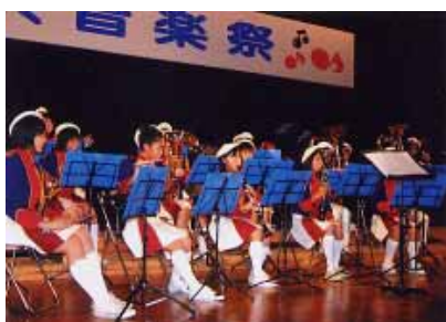
【昨年の白浜音楽祭】