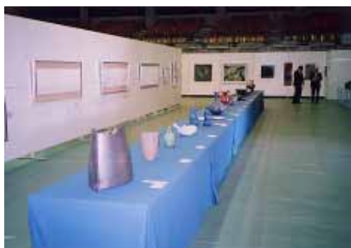
【昨年の白浜展の様子】

県民の美術作品に対する創作意欲を盛んにして、美術文化の向上と発展の一助とするため、毎年和歌山県美術展覧会が開催されています。今年第60回記念和歌山県美術展覧会も、昨年に引き続き移動美術展として「第11回白浜展」を開催します。和歌山県内各地で現在活躍中の方々の作品が展示されます。皆さんお誘いあわせの上、ぜひご鑑賞ください。