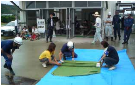
本年6月18日 中区自主防災会主催による防災訓練

このことから、公共機関が発生直後に多数の被害者を助けることは困難であり、救助や初期消火には、近隣住民による組織的な防災活動が大変重要であることがわかります。