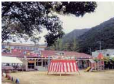
(宝くじ助成金で整備した備品)