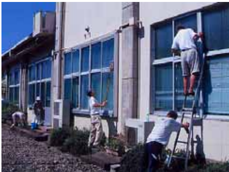
ることができました。参加くださった皆さん、本当にありがとうございました。

各部屋の床をホウキで掃き、廊下とロビーはモップ掛け。また、普段洗っていない換気扇の羽やエアコンのフィルター、集会室のスリッパなどもきれいに水洗いしました。 快晴、夏本番の暑気のなか両日合わせて80人の参加があり、2日とも午前中に終了す