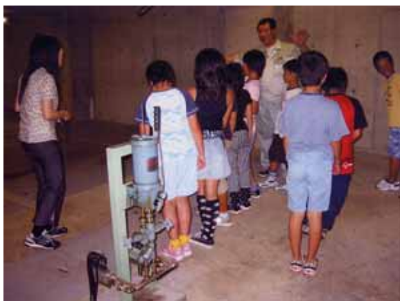
浄化センターを見学する富田小学校4年生