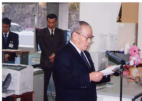
(白浜町役場での開庁式)