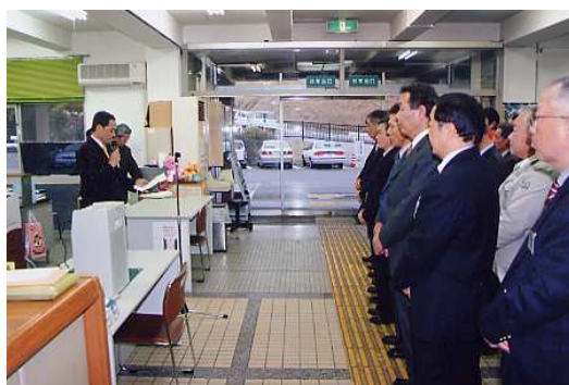
(旧白浜町の閉庁式)

3月1日、新「白浜町」誕生にともない、白浜町役場と日置川事務所において開庁式が行われました。