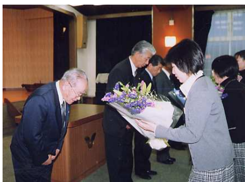
(旧日置川町の閉庁式)

2月28日、それぞれの町で閉庁式が行われ、その歴史に幕がおろされました。閉庁式では、町職員に対し、町長、議長のあいさつのあと、町四役、議長に花束の贈呈が行われました。