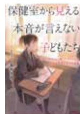
「保健室から見える本音が言えない子どもたち」 桑原朱美／著 青春出版社