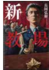
「新・教場」 長岡弘樹／著 小学館