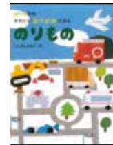
「2～5才のかわいいおりがみえほん のりもの」 いしはなお／作 パイ・インターナショナル