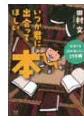
「いつか君に出会ってほしい本 何度でも読み返したい158冊の本」 田村文／著 河出書房新社