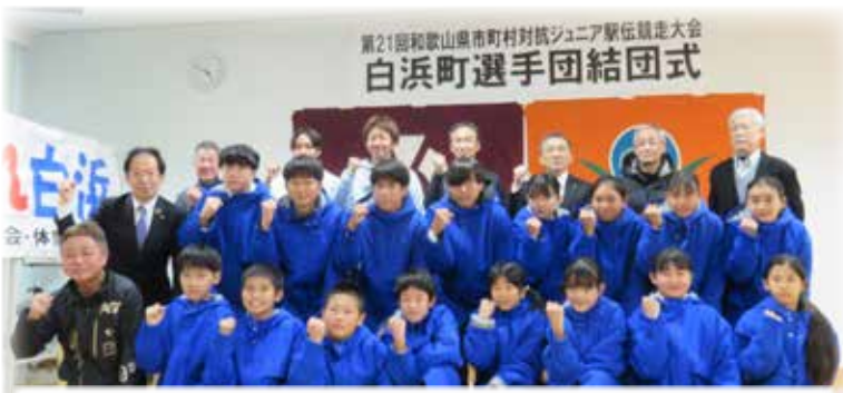
2月20日（日）午前11時 紀三井寺公園陸上競技場スタート！