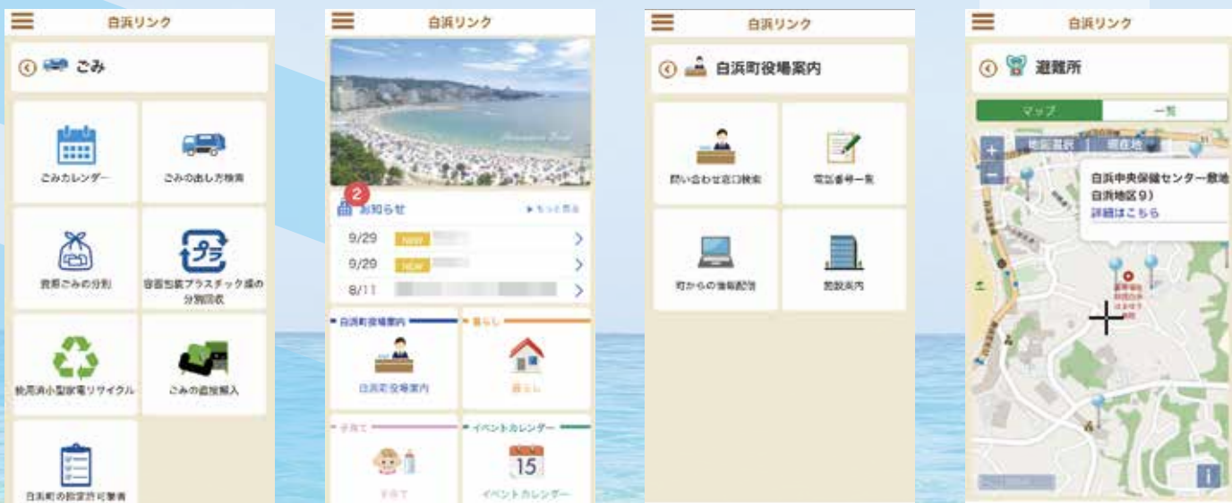
「白浜リンク」(iphone 版) ダウンロードQRコード