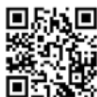
しらはま 安全安心メール QRコード

サービスの利用には、メールアドレスの登録が必要です。「bousai-shirahama-town@raidai2kaiwork.jp」に空メールを送信し、届いたメールの内容に従ってご登録ください。 ※受信料がかかります。