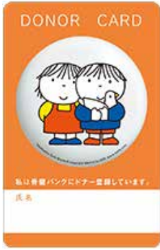
ドナーカード 表面