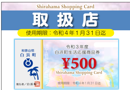
白浜町生活応援商品券取扱店ステッカー

申請書提出後、町から商品券の取扱店舗であることをPRするためのステッカーや換金時の説明書類等を発送します。ステッカーは見やすい場所に掲示いただきますようお願いいたします。