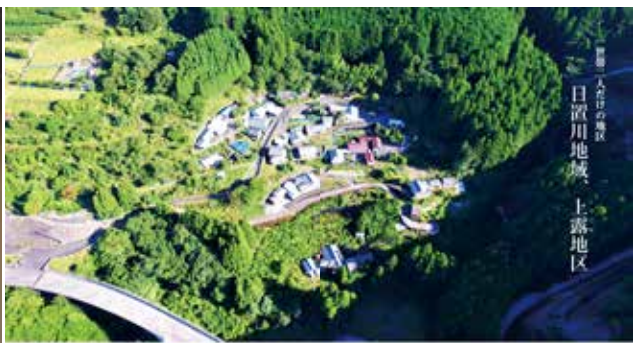
広報白浜9月号(特集ページ)