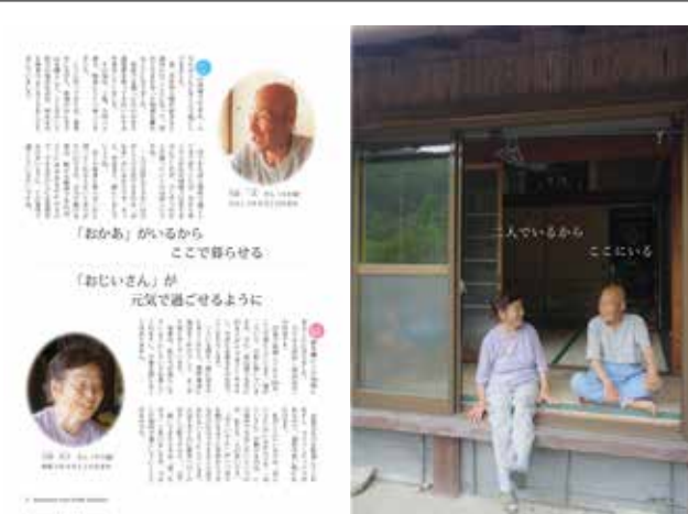
広報白浜9月号(表紙)