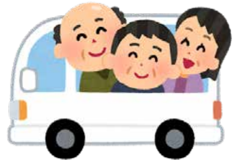
(買い物や通院に支援が求められている)

問 買い物や病院に行きたいが、交通が不便であり、思うように移動ができない人達の声が多くある。そういった声に応えるため、生活支援体制整備事業が生ま