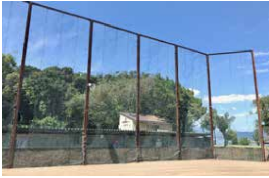
(白浜球場のバックネット)

問 安居暗渠について、県指定文化財の指定に向けた取り組みと、これまでどのような協議をされたのか伺う。また、暗渠碑から暗渠までの看板の設置及び、通路の整備の考えは。