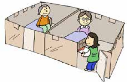
(新型コロナウイルス感染症を想定し、グループ間を間仕切りした避難所)

答 避難所に避難される際の携行品やソーシャルディスタンスの確保、咳エチケット等については、6月広報誌と町ホームページで広報している。避難所における発症は、消防本部と連携し対応する。