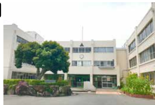
(6月1日から学校が再開されている)

答 予防体制は、通常より感染防止できるものに変更する。また、連携や協議については、応援協定等を締結している。