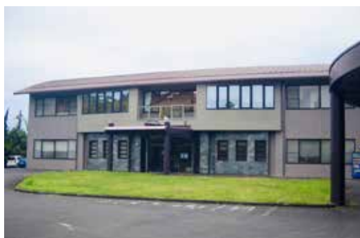
(避難所指定されている百々千園の地域交流ホール)

問 災害避難所において、三密回避のための間仕切り等の確保、避難場所の更なる確保が必要と考えるが、どのような方向性で感染防止に取り組むのか伺う。