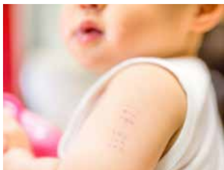
(定期的予防接種は感染症の発生やまん延を防ぐ観点から重要である)

答 新型コロナウイルス感染症による影響で、定期予防接種ができない場合については、公費助成により接種できるように対応していきたい。