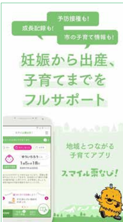
(宮城県栗原市で活用されている、子育てアプリ「スマイル栗なび」)

答 当町の人口規模的に情報提供の手段としてアプリを導入しないと対応できないという状況ではないので、今後の課題とさせていただきます。