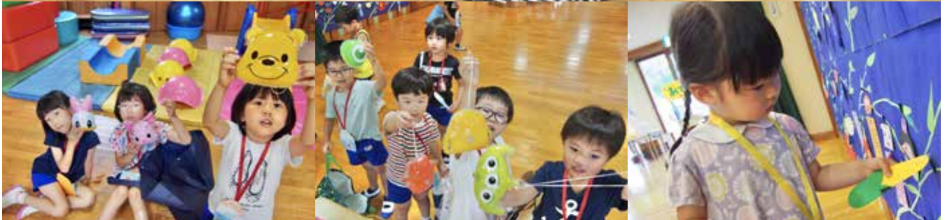
ねがいごと、叶うといいな (白浜幼稚園 七夕まつり)