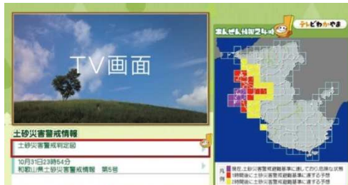
テレビわかやま地上デジタルデータ放送